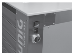
Réglage de la température