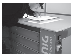
Table de travail