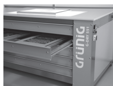
Tiroir de séchage